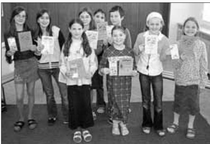
Nejlepší recitátoři na ZŠ Vedlejší